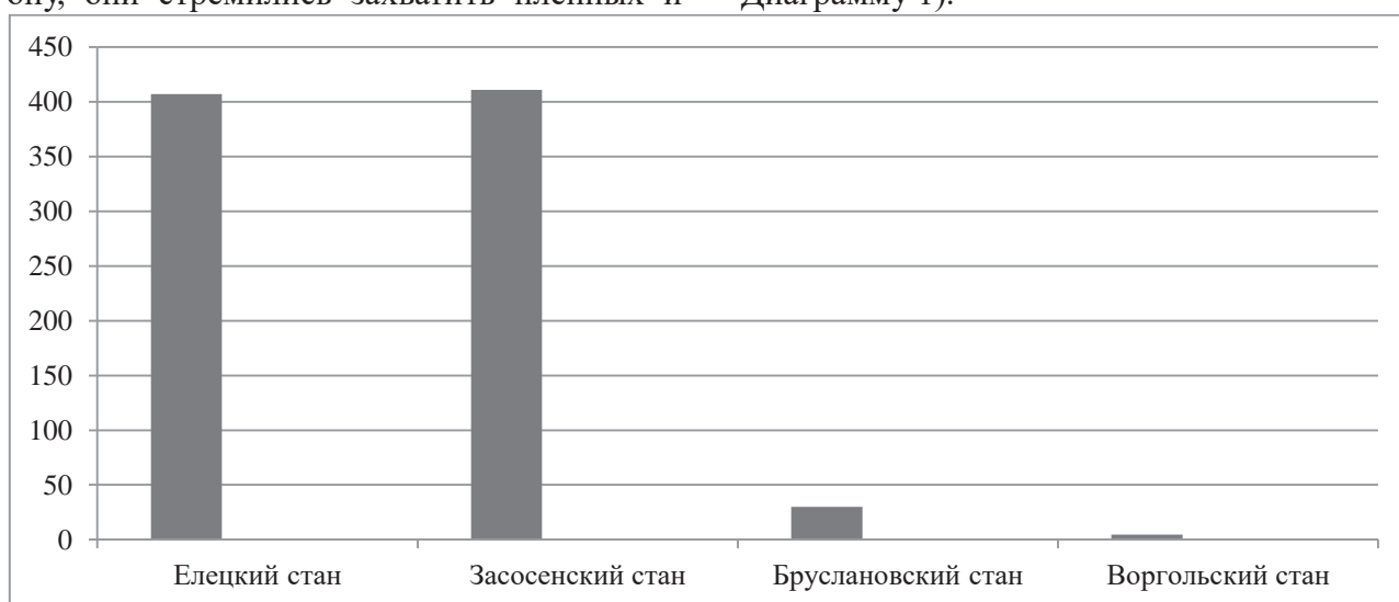
Диаграмма 1. Количество поданных сказок по станам.

Имеющиеся данные по количеству пострадавших поселений в Засосенском стане можно представить в виде диаграммы (См. Диаграмму 1).