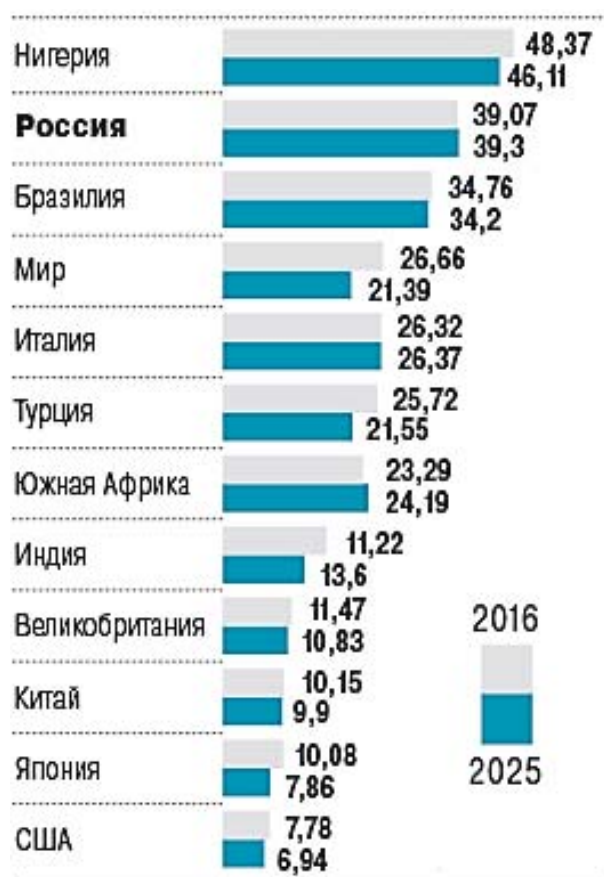
Рис. 1. – Доля теневой экономики в странах мира, % ВВП

рассчитанного ВВП. Или, иначе - рыночное производство товаров и услуг (законных или незаконных), которое избегает обнаружения в официальной оценке валового внутреннего продукта [9]. Более определённо, теневая экономика связана с доходами, полученными от производства, распределения и потребления товаров и услуг посредством денег или бартерных операций, что иначе должно было облагаться налогом. «Серая экономика» является другой формой теневой экономики, где налогооблагаемый доход представлен в символических числах по сравнению с фактическим доходом. Само существование и размер теневой экономики в значительной степени зависят от политической воли государства, которая, в свою очередь, сопряжена с уровнем и масштабами коррупции. Поэтому, теневая экономика и теневая политика тесно взаимосвязаны и зависят друг от друга.