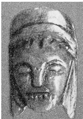
Фото 7. Архаическая головка Артемиды из святилища Артемиды Орфе́и в Спарте (материал – кость)

Таким образом, на основании указанных иконографических характеристик и приведенных историко-религиозных параллелей, рассматриваемую микенскую терракотовую головку с чертами Горгоны из Додоны можно считать изображением доисторического женского божества, связанного с грозными силами дикой природы и представлявшего устрашающий облик древней Великой Богини. Фигурка, которой принадлежала эта головка, могла быть либо вотивным приношением, сделанным в контексте культовой активности в Додоне в микенский период, либо предметом домашнего культа, предназначенным оберегать жилище, в котором она хранилась.