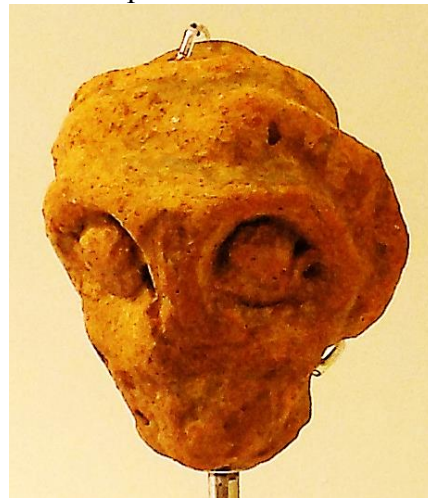
Фото 1-2. Терракотовая головка (6.5 см) доисторического времени, найденная в Додоне

вана для изготовления найденных в святилище керамических сосудов XIII-XI вв. до н.э., ее тоже, видимо, следует датировать позднемикенским периодом. Кроме того, слишком ранняя нижняя датировка головки (XVI в. до н.э.), предлагаемая организаторами выставки, ставит ее в необоснованно исключительное положение среди всего доисторического керамического материала, найденного в Додоне до настоящего времени. По мнению Х. Клитсаса, в данной головке, имевшей функцию оберега и какое-то символически-ритуальное значение, представлен некий «демонический образ» [3, с. 58, № 24], однако такая интерпретация изображения слишком неопределенна.