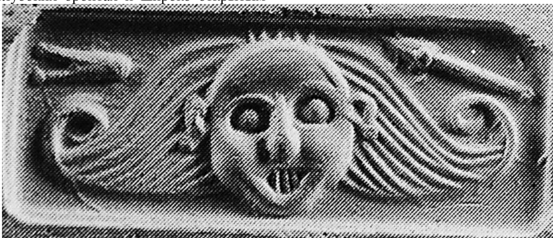
Фото 5. Критская печать среднеминойского периода

ртом, в котором видны длинные, явно нечеловеческие зубы [6, с. 235, № 101a] (см. фото 5).