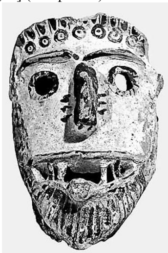
Фото 6. Архаическая терракотовая маска из святилища Артемиды Орфе́и в Спарте

VI-м в. до н.э., имеющая «ужасные» черты лица – большие безжизненные глаза и выступающие изо рта верхние зубы [2, с. 219, pl. 120, fig. 6] (см. фото 7).