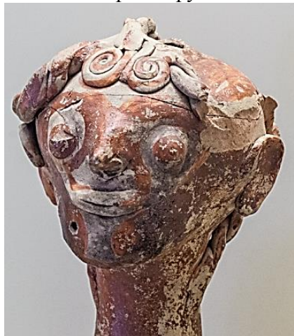
Фото 4. Фрагмент (голова) глиняного идола из Культурного Центра Микен

Микенские мастера переняли эту минойскую манеру исполнения глаз и применяли ее, как правило, при изготовлении вручную цельных терракотовых статуэток; при изготовлении же на гончарном кругу полых статуэток и большего размера глиняных фигур, вместо углублений для глазниц они делали углубления вокруг глаз, что в принципе производило почти такой же эффект [12, с. 25-26, № 28-29; с. 32, № 36-37; с. 50, № 50, и др. терракотовые статуэтки, изготовленные во время греко-микенского присутствия на Крите]. Так, можно отметить разительную схожесть между додонской головкой (см. фото 2) и головами некоторых из глиняных идолов, найденных в Культурном Центре в Микенах (см. фото 4), датируемых примерно XIII-м веком до н.э. [13, с. 52-53; 9, с. 142, fig. 110], несмотря на разницу в размере (головы микенских идолов примерно 10-12 см) и тот факт, что идолы были выполнены на гончарном круге и полы внутри.