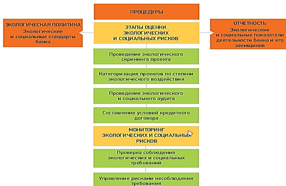
Рис.2 Система по управлению экологическими и социальными рисками Сбербанка

Также в группе Сбербанк была сформулирована концепция ответственного финансирования, которая заключается в первую очередь в учете социальных и экологических рисков в кредитно-инвестиционном процессе (Рис. 2). Их учет является элементом системы риск-менеджмента банков, так как социальные или экологические проблемы заемщиков могут повлечь за собой финансовые и репутационные риски для самих финансовых организаций. Практика ответственного финансирования только начинает внедряться в банках группы, и в настоящее время отсутствует единая политика по управлению социальными и экологическими рисками. При определении подхода к их учету банки группы ориентируются в первую очередь на требования законодательства в странах присутствия и зрелость финансовых рынков.