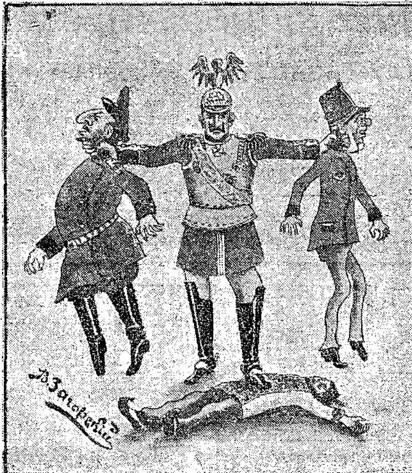
Рис. 3 — Кайзер выжимает последние соки. Петроградская газета. 21 февраля 1916