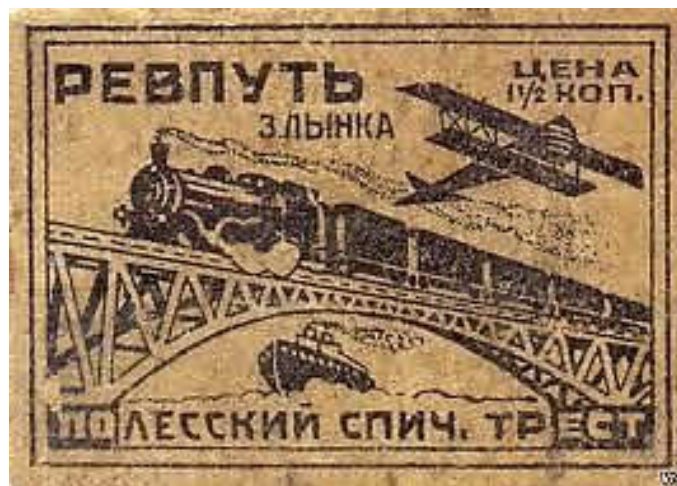
Этикетка спичечной фабрики «Ревпутъ». 1920 –гг.