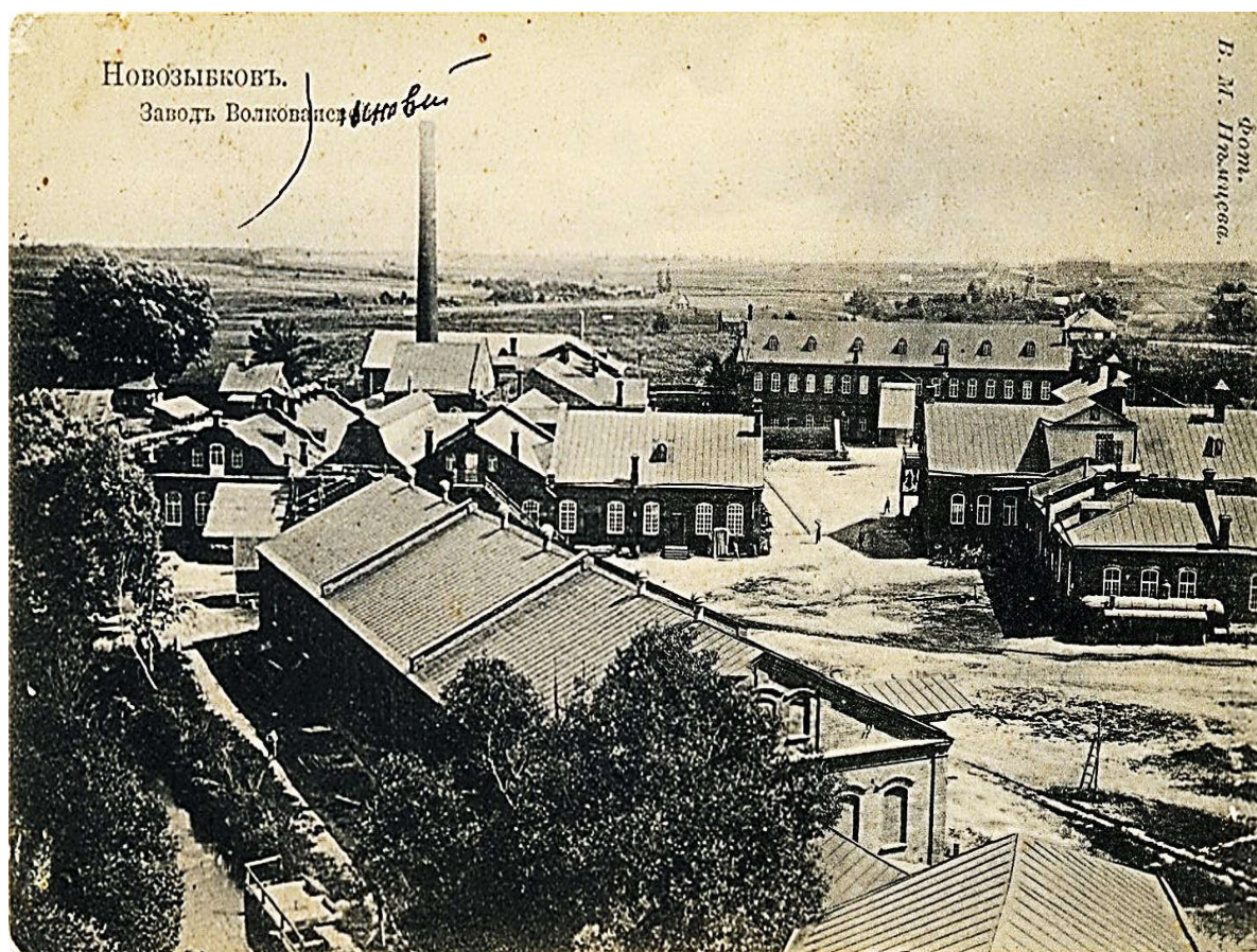
Г. Новозыбков. Завод М.М. Волкова Начало XX в.