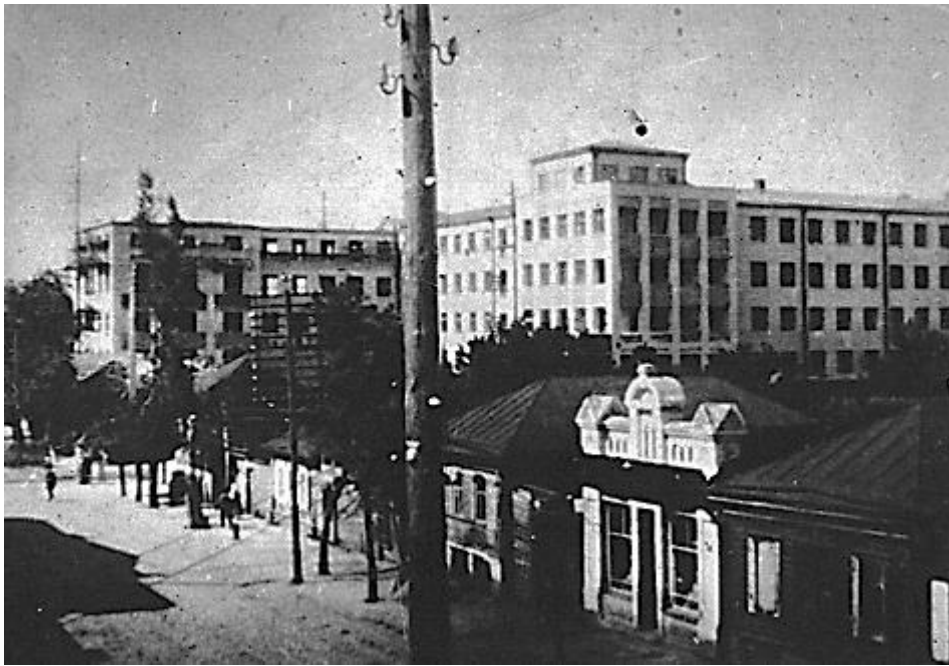
Дом Советов. Клинцы. 1930-е гг.