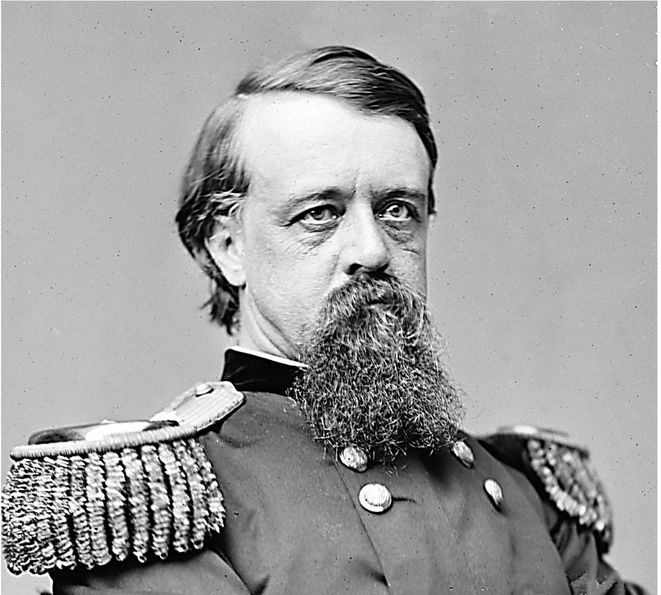
Рис. 4. Генерал США Альфред Х. Терри. Фото между 1860 и 1875 г.