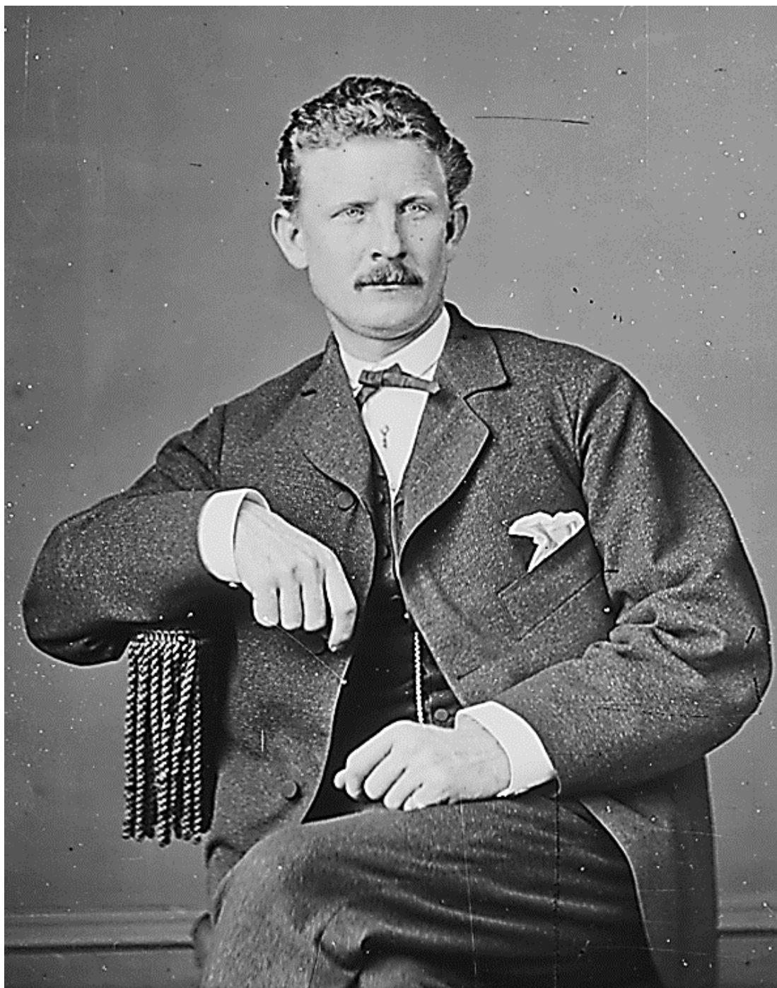
Рис. 5. Генерал США Джозеф Б. Кидду. Фото примерно между 1860 и 1865 гг.